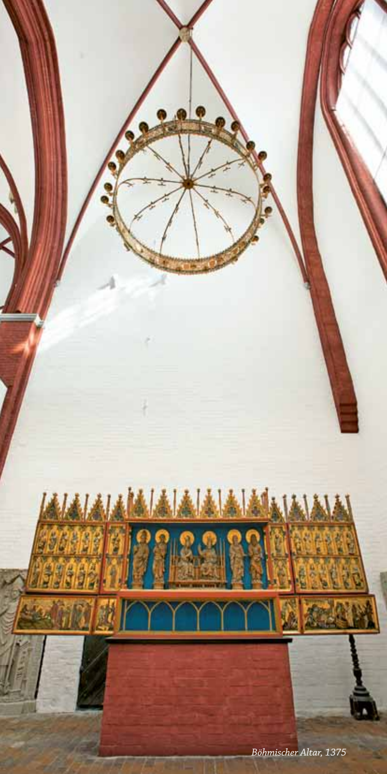
Böhmischer Altar, 1375